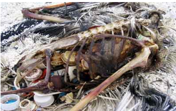
Foto : Schraubverschlüsse und andere Plastikteile wurden diesem Layson-Albatross zum Verhängnis

Der Plastikmüll stellt für viele Meerestiere eine elementare Bedrohung dar. Meeressäuger verstricken sich in abgerissenen Fischernetzen, Seevögel ersticken in den Plastikringen von Sechserpackträgern. Plastik im Meer wird zudem von Hochseevögeln wie Albatross und Eissturmvogel mit Nahrung verwechselt. Die Tiere verhungern und verdursten, da die Plastikteile ihre Mägen verstopfen und keinen Platz mehr für Flüssigkeit und echte Nahrung lassen. Zudem wird der Plastikmüll an die Nachkommen verfüttert, denen das gleiche Schicksal droht. Mittelbar trägt das Plastik so zum Tod der Vögel bei, da deren Kondition massiv geschwächt wird. Europäische Wissenschaftler fanden während einer Studie in 97% der untersuchten Nordsee-Eissturmvögel Plastikteile in den Mägen 2 . Zwei von fünf Layson-Albatross-Küken sterben auf einer der hawaiianischen Inseln innerhalb der ersten sechs Lebensmonate, da ihr Magen zwar gefüllt und ihr Hunger gestillt ist, ihre Hauptnahrung aber aus Plastik besteht und keinerlei Nährstoffe enthält.